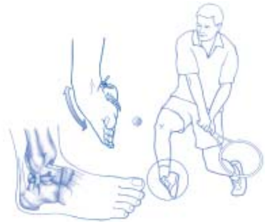
figuur 1. De verstuikte enkel

De enkelverstuiking, ook wel distorsie, verzwikking of verdraaiing genoemd, is de meest voorkomende blessure bij tennis. In de meeste gevallen ontstaat de blessure bij een landing op de buitenzijde van de voet, waarbij de voet (te ver) naar binnen draait. Hierbij raken de (relatief zwakkere) buitenste enkelbanden beschadigd ( Figuur 1 ). Een blessure van de veel sterkere band aan de binnenzijde van de enkel komt veel minder vaak voor (5-10% van de gevallen). Afhankelijk van de ernst van de blessure zijn de banden uitgerekt of gescheurd, waarbij de enkel instabiel kan worden. Symptomen zijn pijn en zwelling rondom de enkel, voornamelijk aan de buitenzijde, later gevolgd door een paars-blauwe verkleuring van de huid.