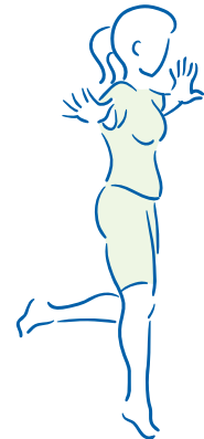
figuur 3. Oefenen van de coördinatie